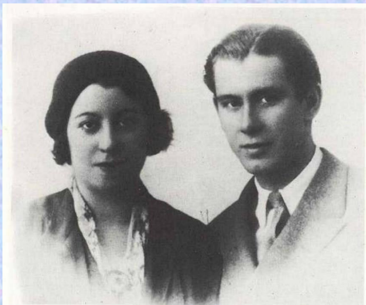
Concha Méndez y Manuel Altolaquirre, de novios. 1932.