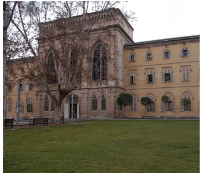
Edifici del Rectorat de la UdL