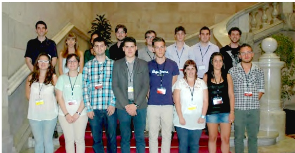
Els membres del 'Govern' universitari, amb 3 estudiants de la UdL

L'experiència consisteix en esdevenir diputats, periodistes, juristes o desenvolupar altres tasques. Una alumna de la UdL ha exercit com a secretària de la Mesa del Parlament, mentre tres companys seus han estat consellers del Govern, a les carteres de Governació, Agricultura i Justícia. Cabasés destaca que l'alumnat agafa experiència en el treball en grup, les competències transversals i l'oratòria.