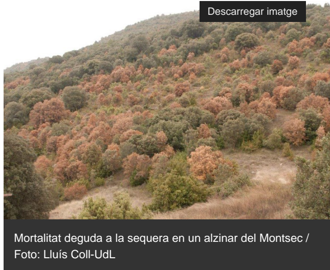
Mortalitat deguda a la sequera en un alzinar del Montsec

http://blog.creaf.cat/coneixement/que-son-els-serveis-ecosistemics/ ] (beneficis ambientals com ara l'absorció de carboni o la biodiversitat) que aporten els boscos. Així ho afirma una recerca on han participat experts de la Universitat de Lleida (UdL), el Centre de Ciència i Tecnologia Forestal de Catalunya (CTFC) i el CREAL que s'acaba de publicar a la revista científica Global Change Biology [ https://onlinelibrary.wiley.com/journal/13652486 ]. L'article forma part d'un estudi sobre escalfament global a la Mediterrània, impulsat per l'equip del projecte MedECC [ https://www.medecc.org/ ], que vol complementar els informes periòdics del Panell Intergovernamental de Canvi Climàtic [ https://www.ipcc.ch/ ] (IPCC).