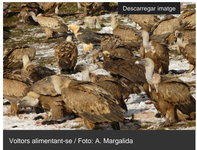
Voltors alimentant-se

Les activitats turístiques relacionades amb els punts d'alimentació suplementària de les aus carronyaires generen un impacte econòmic de 4,2 milions d'euros anuals de mitjana a les zones de Catalunya i l'Aragó que els acullen. D'aquests, uns 2,2 milions es queden al territori. Aquestes són les estimacions d'una recerca liderada per la Universitat de Lleida (UdL) publicada a la revista Ecological economics [ https://www.journals.elsevier.com/ecological-economics ]. L'estudi, que s'ha realitzat amb experts de l'IREC-CSIC [ https://www.irec.es/ ] i la Universitat Miguel Hernández d'Elx, quantifica econòmicament per primer cop a Europa els beneficis de les activitats culturals relacionades amb els voltors.