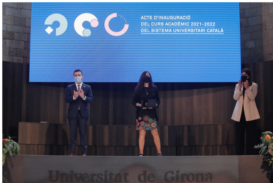
Moment del lliurament