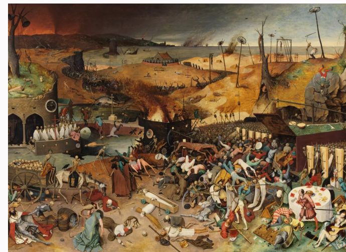
Pieter Bruegel el Viejo: El triunfo de la Muerte