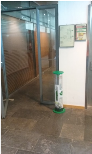
Vestíbul de les aules de la planta baixa