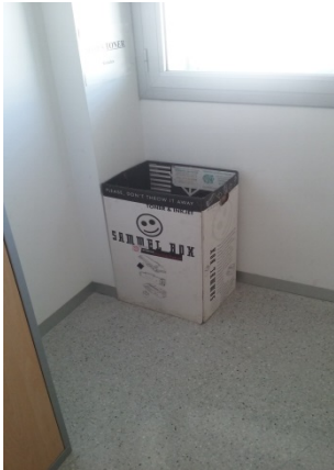
Dept. Privat – Espai 3.08