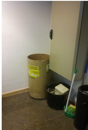
Tercera planta ORDI