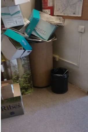
Consergeria de l'edifici

Les impressores i copiadores de l'edifici de l'EPS són centralitzades i distribuïdes per plantes. Gran part del PDI no disposa d'impressores personals. Per la qual cosa els tòners utilitzats de les secretaries, es recullen i guarden en la consergeria de l'edifici. L'empresa de recollida és OFIK