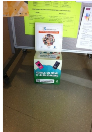
Vestíbul de la planta baixa de l'edifici