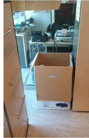
Secretaria Institut de Llengües