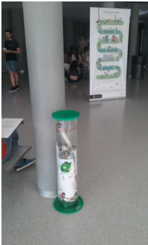
Vestíbul de la planta - 1 de l'edifici