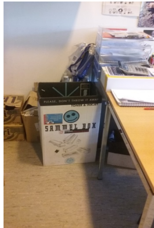
Segona planta ORI

El SIAU, el Servei d'Esports i el Negociat Econòmic dipositen els tòners gastats, en contenidors de les diferents plantes de l'edifici