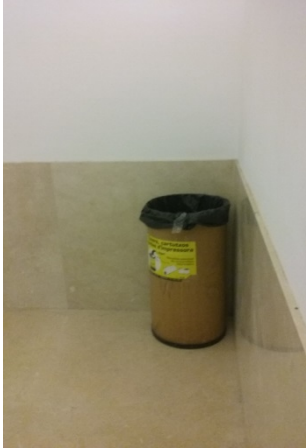
Planta baixa de l'escala auxiliar del deganat