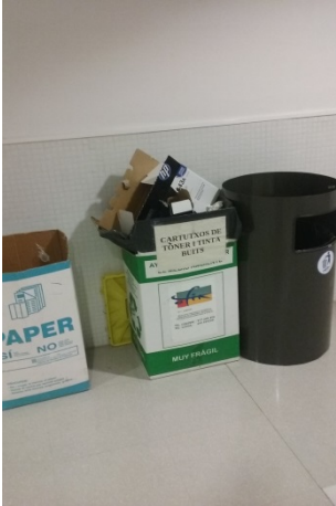
Passadís zona ICE/CFC

Els diferents Serveis i dependències ubicats al Polivalent dipositen els tòners en el contenidor de l'edifici