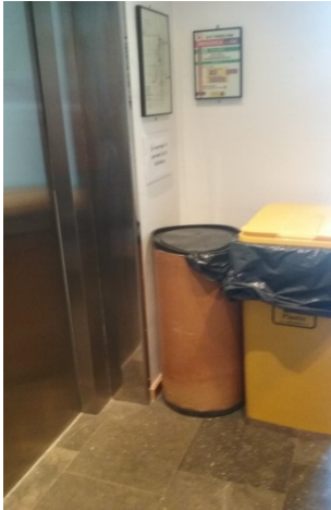
Primera planta de la biblioteca