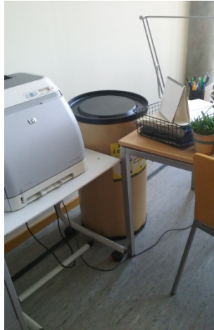
Segona planta UTC – 2.07