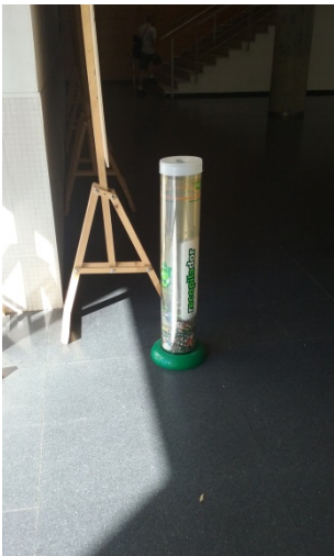
Vestíbul de la planta - 1 de l'edifici