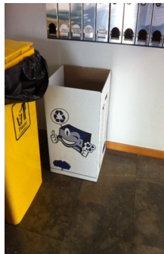
Vestíbul de la planta baixa