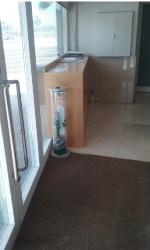
Vestíbul de la planta baixa de l'edifici