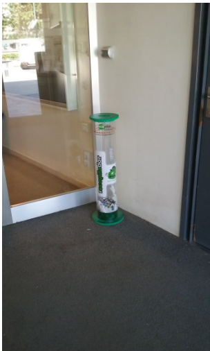
Vestíbul d'entrada de l'edifici