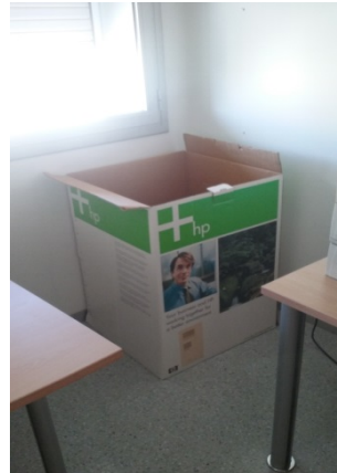
Dept. Públic - Espai 2.07

Els departament d'ECONAP i d'AEGERN entreguen els torners gastats a la consergeria de l'edifici o els dipositen en contenidors d'altres edificis.