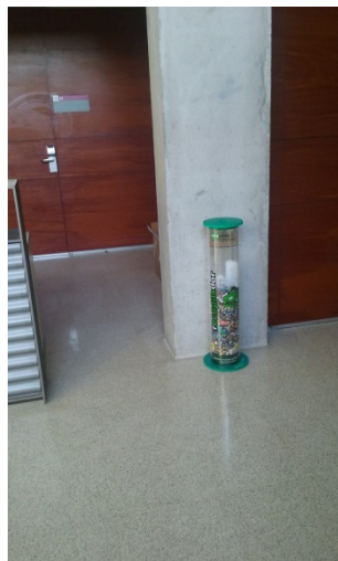
Vestíbul de la planta baixa de l'edifici