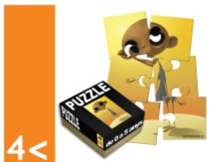
il·lustració: victor ribas

3 < promoure la igualtat entre els sexes i l'autonomia de la dona