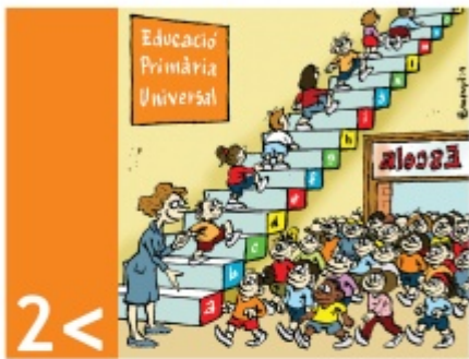
2 < assolir l'ensenyament primari universal