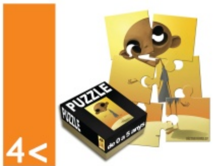
4 < reduir la mortalitat infantil