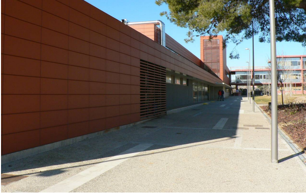
Edifici de Serveis Científico-Tècnics a l'ETSEA, cofinançat per la Generalitat Catalana (Pla Plurianual d'Inversions Universitàries PPIU) i els Fons FEDER.