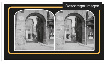
La fotografia estereoscòpica a les comarques de Lleida 1896 - 1960