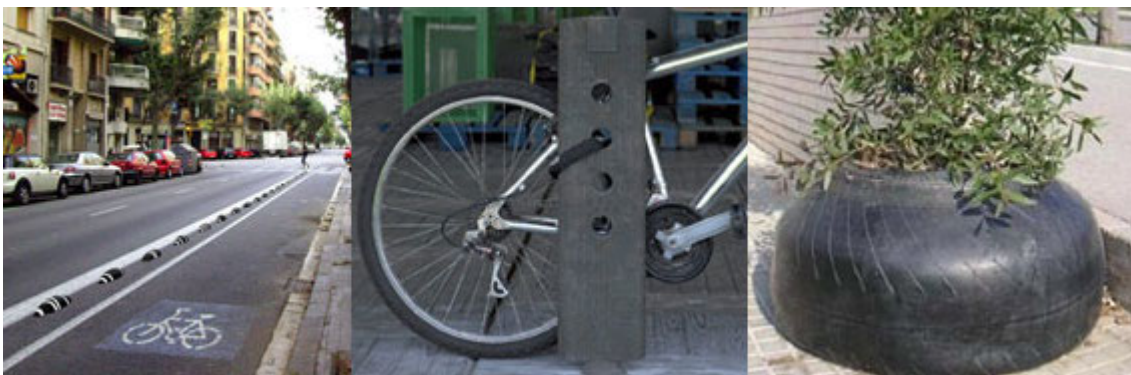
Algunes de les imatges de l'exposició: Disseny per al Reciclatge: Producte Reciclat/Reciclable