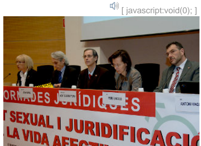
Inauguració de les darreres jornades jurídiques

La Llei de la Memòria Històrica, els límits de la justícia penal internacional i les comissions de la veritat són alguns dels temes que es posaran sobre la taula a les XX Jornades Jurídiques de la Facultat de Dret i Economia de la Universitat de Lleida [ http://www.dpub.udl.cat/jornadesjuridiques/ ], que tindran lloc els dies 26 i 27 d'octubre al Centre de Cultures i Cooperació Transfronterera, al campus de Cappont. L'encarregada d'inaugurar-les serà la consellera de Justícia de la Generalitat, Montserrat Tura.