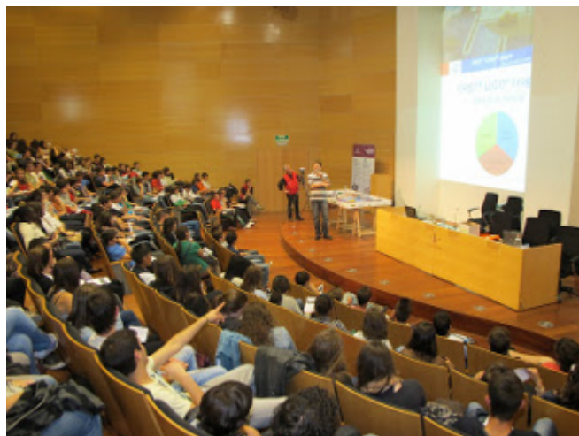
/export/sites/universitat-lleida/ca/serveis/c Inauguració del MERCATEC 2012 a l'Auditori del Centre de Cultures

Uns 1.290 alumnes d'ESO i Batxillerat de 19 instituts de les comarques de Ponent assistiran al Mercat de Tecnologia [ http://www.mercatdetecnologia.udl.cat/ ], que tindrà lloc aquest dijous al campus de Cappont de la Universitat de Lleida (UdL). La iniciativa, que compta amb el suport de la conselleria d'Ensenyament, pretén donar continuïtat a la tasca que durant 9 anys ha portat a terme MERCATEC. La Xarxa Mercat de Tecnologia està composta per la UdL, la Universitat de Vic i l'Escola d'Enginyeria de Terrassa de la Universitat Politècnica de Catalunya.