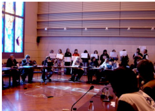
javascript:void(window.open('http://www.udl.cat/...')) Moment de la lectura del manifest

Saura. També han criticat que l'equip de govern de la UdL no s'hagi posicionat "amb claredat" davant tots aquests fets. Els anti-Bolonya han anunciat que abandonen les taules de debat sobre l'EEES com a representants de l'Assemblea d'Estudiants de Facultats i Escoles de la UdL que es porten celebrant des del passat mes de febrer i que han titllat "d'entreteniment que ofereix l'Equip rectoral per mirar d'adormir" la seua lluita. Per la seua part, el rector i el seu equip han reiterat la seua voluntat de diàleg amb l'estudiantat i han assegurat que les taules de debat continuaran, ja que aquest era el compromís a què es va arribar.