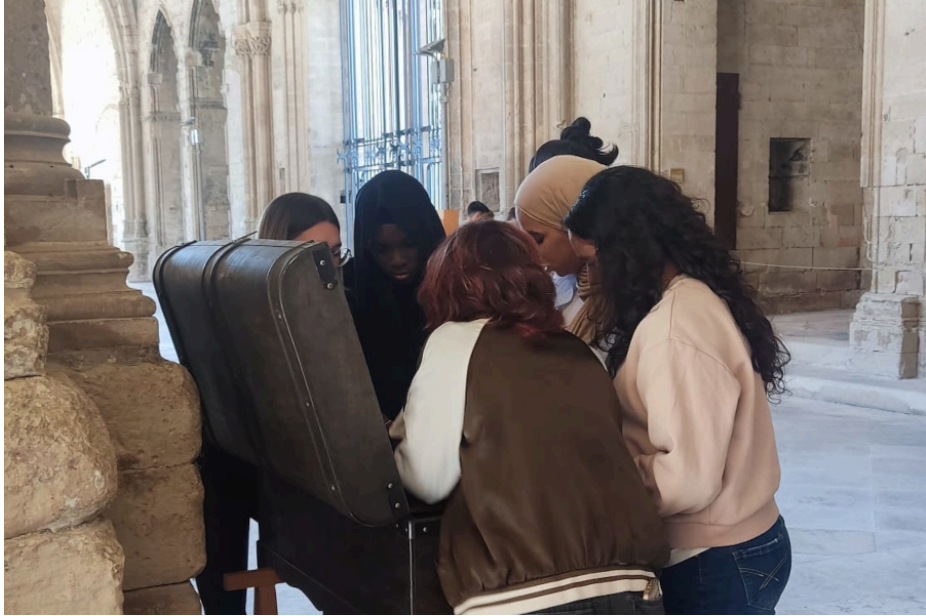
Un autre moment de la 'box escape'