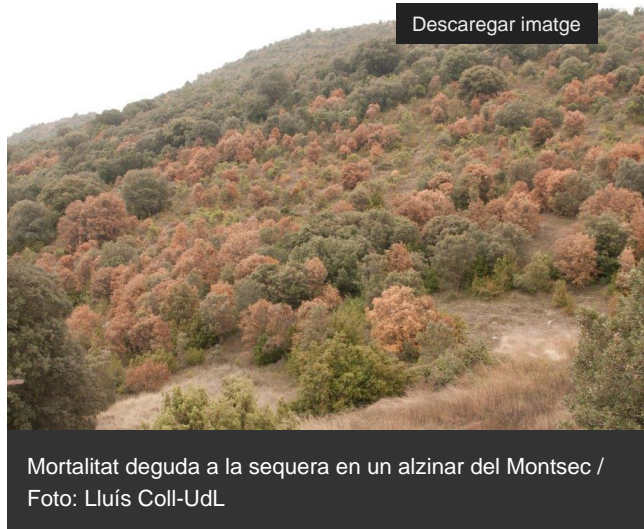
Mortalitat deguda a la sequera en un alzar del Montsec

http://blog.creaf.cat/coneixement/que-son-els-serveis-ecosistemics/ ] (beneficis ambientals com ara l'absorció de carboni o la biodiversitat) que aporten els boscos. Així ho afirma una recerca on han participat experts de la Universitat de Lleida (UdL), el Centre de Ciència i Tecnologia Forestal de Catalunya (CTFC) i el CREAL que s'acaba de publicar a la revista científica Global Change Biology [ https://onlinelibrary.wiley.com/journal/13652486 ]. L'article forma part d'un estudi sobre escalfament global a la Mediterrània, impulsat per l'equip del projecte MedECC [ https://www.medecc.org/ ], que vol complementar els informes periòdics del Panell Intergovernamental de Canvi Climàtic [ https://www.ipcc.ch/ ] (IPCC).