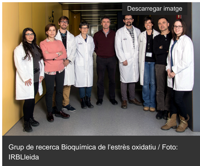
Grup de recerca Bioquímica de l'estrès oxidatiu

Investigadors de la Universitat de Lleida (UdL) i l'Institut de Recerca Biomèdica de Lleida (IRBLleida) intentaran validar el potencial terapèutic del calcitriol [ https://es.wikipedia.org/wiki/Calcitriol ], un metabòlit actiu de la vitamina D3, per tractar l' Atàxia de Friedreich [ https://ca.wikipedia.org/wiki/At%C3%A0xia_de_Friedreich ], una malaltia rara neurodegenerativa que es caracteritza per una destrucció de certes cèl·lules nervioses de la medul·la espinal, el cerebel i els nervis que controlen els moviments musculars en els braços i les cames. L' Associació francesa de l'Atàxia de Friedreich [ https://www.afaf.asso.fr/ ] ha concedit una ajuda de 25.000 euros per aquest estudi.