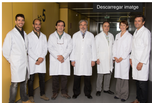
Grup de neurocognició.

Una trentena d'investigadors es donen cita aquest divendres a la Universitat de Lleida (UdL) en el marc d'una jornada internacional en recerca en psicologia [