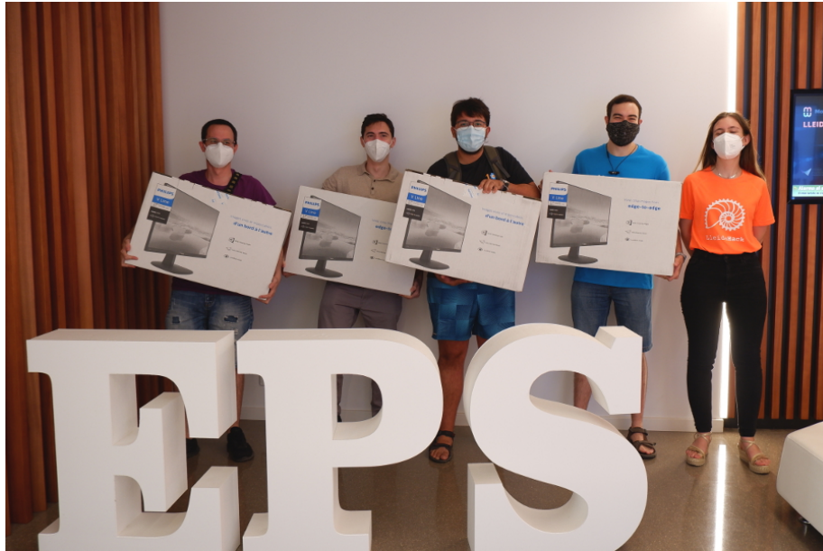
Els guanyadors de l'Hackató, amb els premis / Foto: EPS-UdL