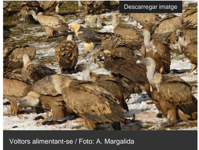
Voltors alimentant-se / Foto: A. Margalida

L'estudi, que s'ha realitzat amb experts de l' IREC-CSIC [ https://www.irec.es/ ] i la Universitat Miguel Hernández d'Elx, quantifica econòmicament per primer cop a Europa els beneficis de les activitats culturals relacionades amb els voltors.