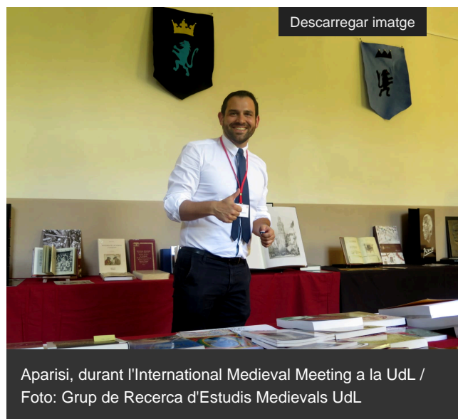
Aparisi, durant l'International Medieval Meeting a la UdL

D'altra banda, el grup de Malherbologia i Ecologia Vegetal de la UdL [